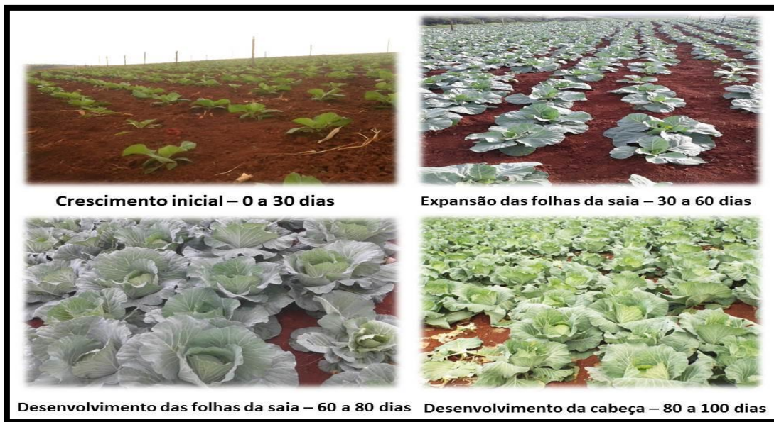
Figura 3- Desenvolvimento do repolho

De uma forma mais simplificada, pode-se dividir o desenvolvimento vegetativo do repolho em quatro estádios de crescimento, visualizados na Figura 3.