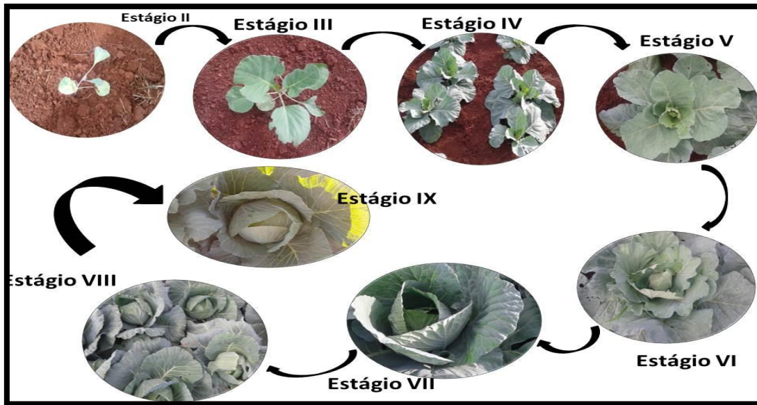
Figura 2- Representação esquemática dos estádios fenológicos do repolho