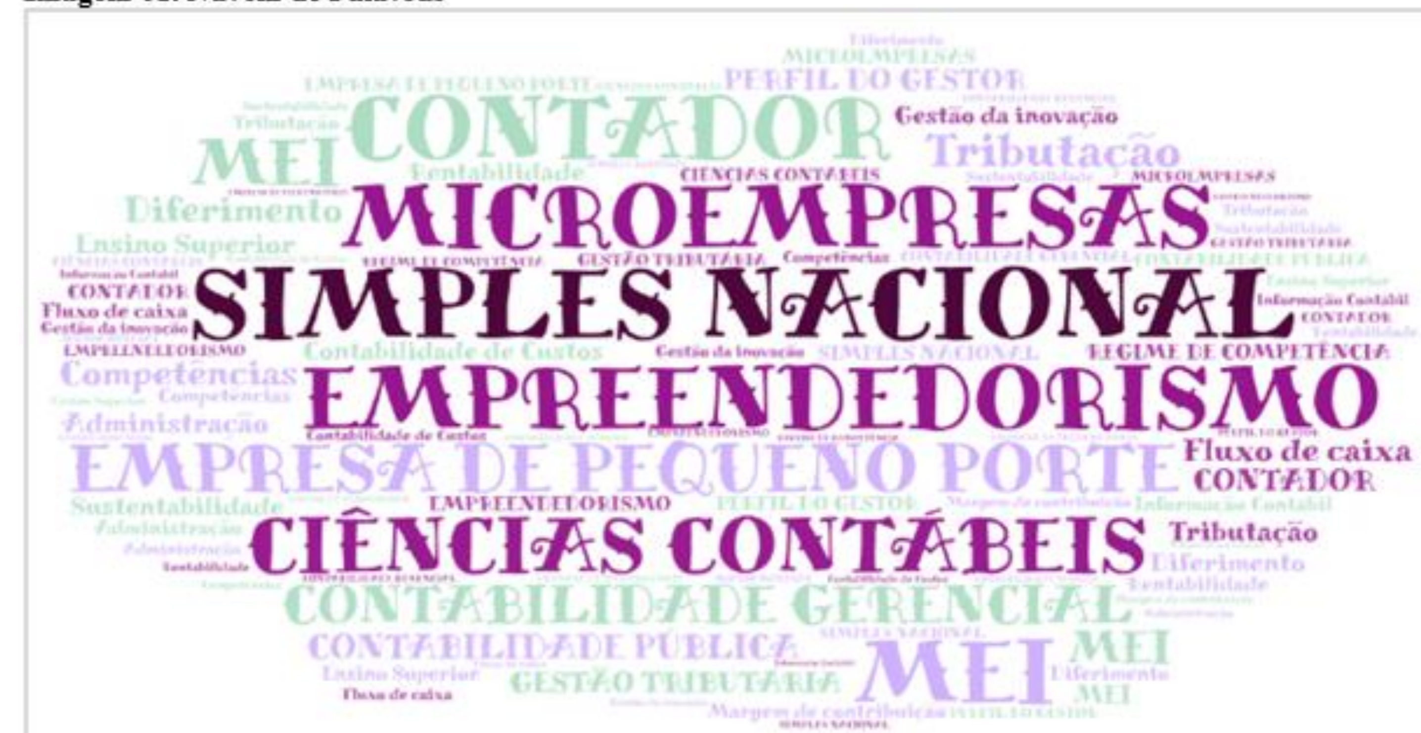
Imagem 01. Nuvem de Palavras