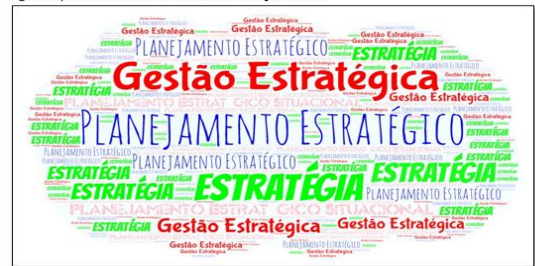
Figura 01- Palavras-chaves mais citadas nos periódicos